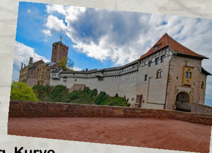
lapping auf Pixabay

Eine Vielzahl von Burgen, Kirchen und Schlössern sind hier zu finden. Verbunden durch traumhafte Motorradstrecken. Wald, Kurve, Wald, Berg, Kurve, Wald, Berg, ... - so schlängeln sich die Straßen durch die Region. Was natürlich nicht vernachlässigt werden darf sind die kulinarischen Leckerbissen: Die Thüringer Rostbratwurst.